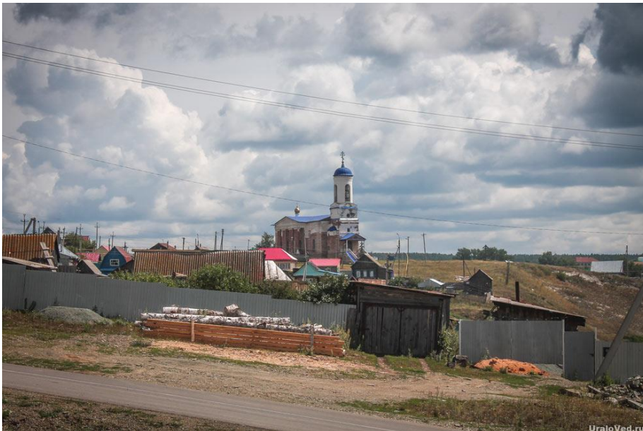
расположено Зилаирское плато .

Неподалёку на высоком левом берегу стоит Спасо-Преображенская церковь . Её построили в 1830 году. Есть в селе и мечеть. В самом селе сохранились здания