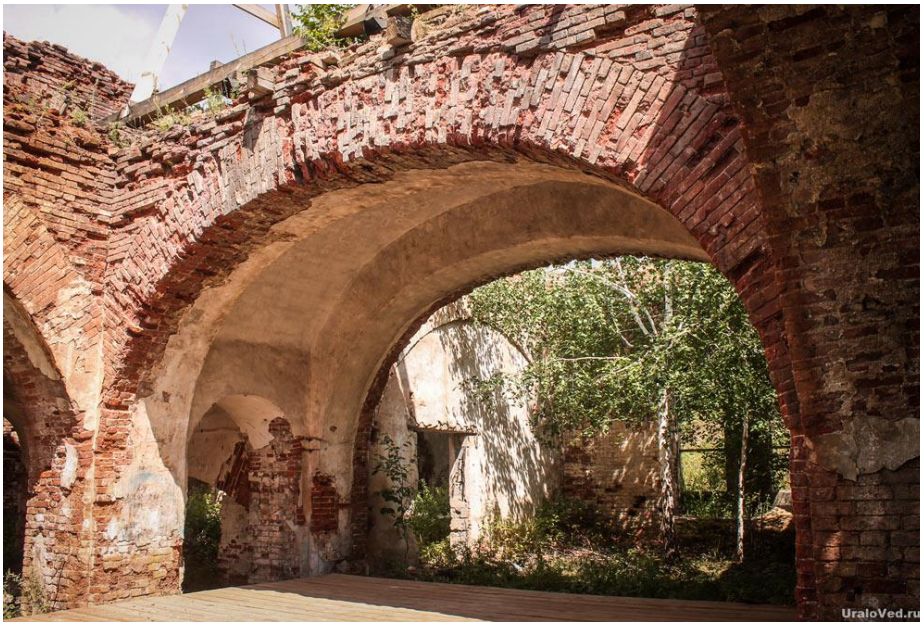
бывших купеческих особняков.

Неподалёку на высоком левом берегу стоит Спасо-Преображенская церковь . Её построили в 1830 году. Есть в селе и мечеть. В самом селе сохранились здания